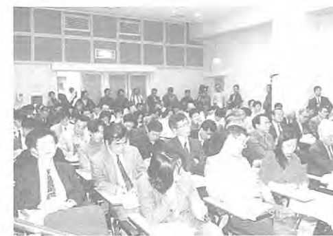
立ち見がてるほどの盛況だった「復興まちづくり報告97」