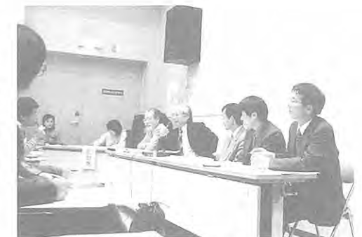
報告会の締めくくりに行われた感想激励討論