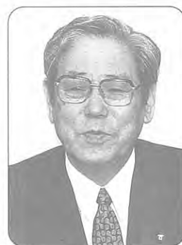
(財)神戸市都市整備公社理事長 神戸市長