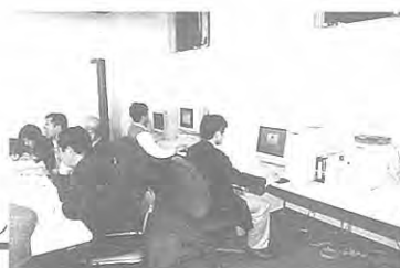
調査・研究ゾーン

今、こうべまちづくり会館3階の旧展示室を改造してコンピュータなどの情報機器を配備、集められた「まちづくり情報」を検索システムに取り込みつつあります。秋ごろには皆様にご利用いただける予定です。4階の図書・ビデオライブラリと合わせて「人と情報が交流する場」づくりをめざします。ご期待ください。