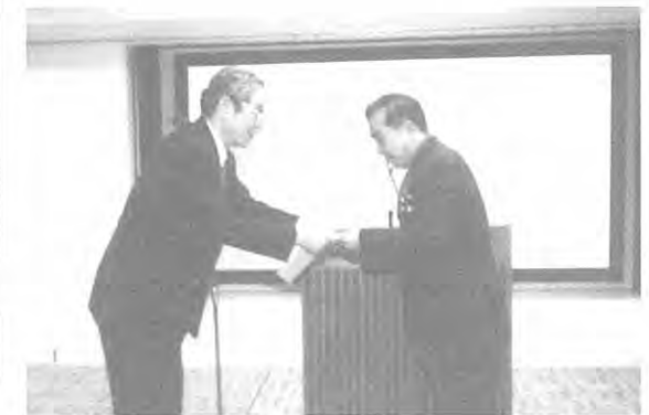
市長による市民安全推進員への委嘱

市民が防災についての専門的、実践的な知識を習得するための場として、平成9年9月に開講した「こうべ市民安全まちづくり大学」が、半年以上にわたる講座日程を無事に終え、3月12日(木)に修了式を迎えました。