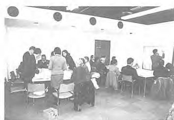
研修・啓発ゾーン