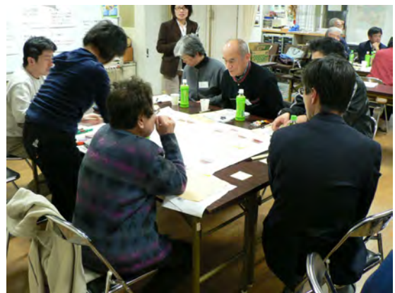
各グループで意見を出しあう！

12月3日（日）の午後5時半から、横尾地域福祉センターに地域の住民約20名が集まり、ワークショップを開始。街角企画（株）の