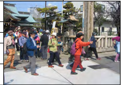
前回のラリー風景