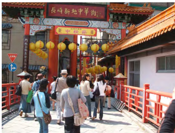
分科会C（まちに馴染んだ異国文化）でのタウンウォッチング（新地中華街）

さらに、この公園につながる松が枝埠頭には、たまたま大型旅客船「SAPHIRE PRINCESS 号（バミューダ船籍、115,875 t）」が接岸しており、市街地と直に接した港にそびえる威容は感動的ですからあり、神戸のウォーターフロントのあり方を再考させられる経験でした。