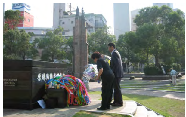
分科会A（祈りの長崎・平和希求のまちづくり）での献花（平和公園）

会議のメインである2日目には、「祈りの長崎・平和希求のまちづくり」「洋館・石畳・港が語り継ぐまち」「まちに馴染んだ異国文化」という3つの分科会に別れ、タウンウォッチング、講演／パネルディスカッション、ワークショップなど、さまざまな形でまちを見聞し、自分たちのまちと比較し、いろいろな立場から意見を出し合いました。