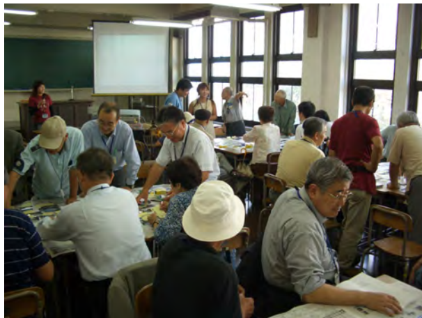
分科会B（洋館・石畳・港が語り継ぐまち）でのワークショップ（活水女子大学）