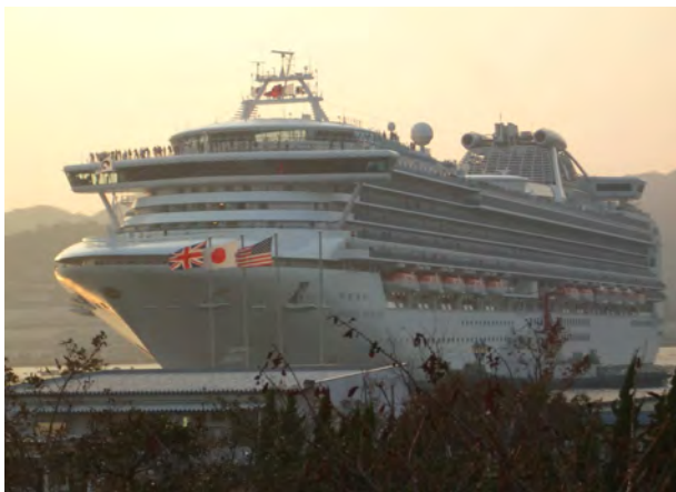
松が枝埠頭を離れる「SAPHIRE PRINCESS 号」（115,875 t）

またウォーターフロントには、「水辺の森公園」や「長崎県美術館」が完成しており、ウェルカムパーティや最終日の全体会議はここで催されました。もともと大型商業施設を建設する予定で埋め立てられた土地の計画を変更して公園が整備されたそうですが、市民に開放された憩いの場として、海に面した長崎のイメージを非常に高めていると感じました。