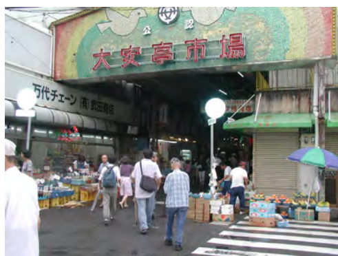
昨年度のまち歩きと ワークショップの様子