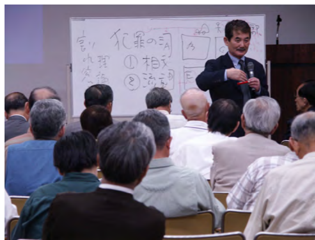
今年の基礎講座の様子