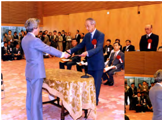
表彰を受ける、「旧居留地連絡協議会」↑と「御蔵通5・6丁目町づくり協議会 & まち・コミ」→