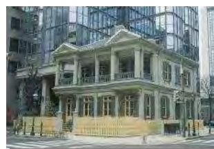
復興建築賞／旧神戸居留地15番館