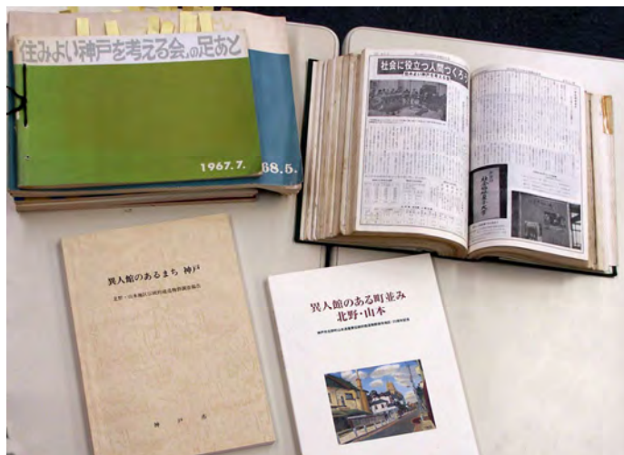
収集した資料の一部