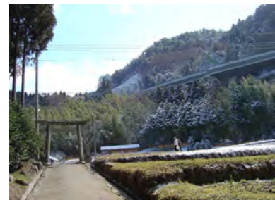
豊かな自然と歴史～山王神社より六甲山を臨む

協定の特色として、まちを大きく変えていくのではなく、豊かな自然と歴史を財産として、現在の環境を残すことを目標としていることがあげられます。