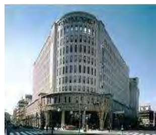
復興建築賞／大丸神戸店