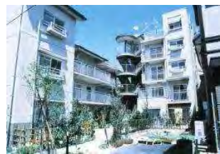
すまいいなみ賞／東尻池コート