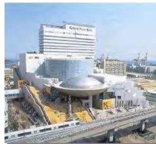
文化賞／神戸ファッションプラザ