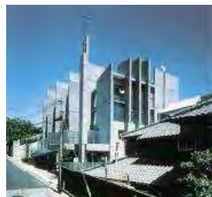
文化賞／日本イエス・ キリスト教会垂水教会