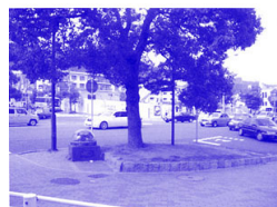
モデルガーデンとする地区 中山手通三丁目交差点歩道 (左地図★印)