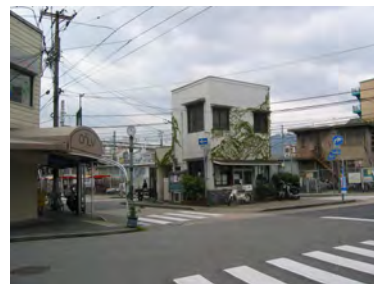
(阪神青木駅前の1コマ)

○青木地区には、地域の交通の拠点として、阪神青木駅がありますが、駅前周辺は震災で被災した市場周辺の再開発や、阪神電鉄の連続立体交差事業が控えており、工事に伴い駅前周辺は大きく変わろうとしています。地区の玄関でもあるこの場所が、どのように変わっていくのか、地域の方々には大きな課題です。