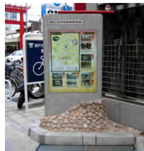
地下鉄EV前にあります