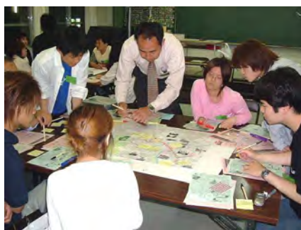
長田商業高校でのワークショップ

(参加していた役所の人間は終電を気にして途中で帰るのでシンデレラと呼ばれていました)。