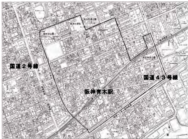
(青木地区まちづくり協議会エリア図)