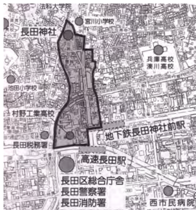
長田神社周辺地域

地下鉄長田駅を降りたところに大きい赤い鳥居があるのはみなさんご存知だと思います。ここから500mほど北にある長田神社との間には、商店街や市場など多くのお店が並んでいます。