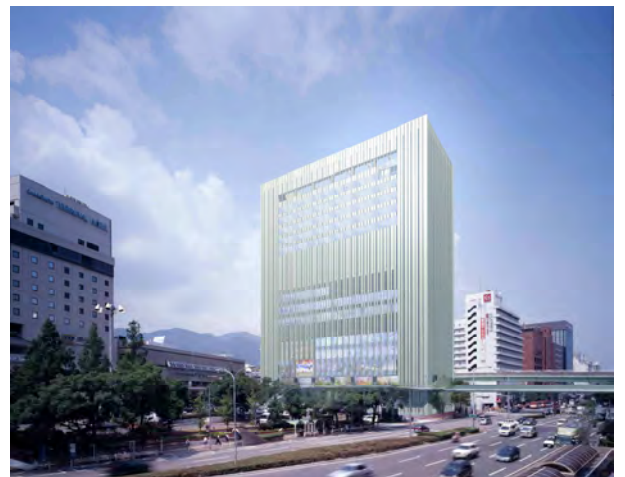
(仮称) 神戸新聞会館ビルの完成予想図

震災で被災した神戸新聞会館は、民間による都市再生事業に認定され、神戸の顔にふさわしい風格あるデザインの多様な用途を持つ複合施設ビル(仮称・神戸新聞会館ビル)として、平成18年秋の完成に向けて再建が進められています。