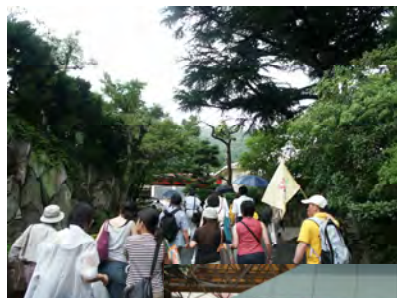
北野の小道、隠れた魅力、

〇古くから多くの人々が暮らしてきた下町。それぞれの地域の個性や、人と人、人と町のつながりを尊重しながら住宅復興がすすめられた町々を巡ります。