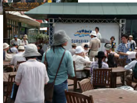
まち協の方からサンシャインワープで