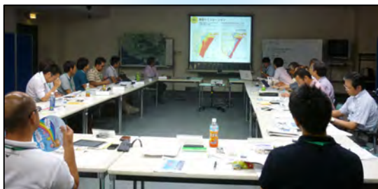
各自治体の被災状況を報告する参加者

その内容は、K-TECから、神戸の復興の過程やその間の問題点についての説明と18年目の現在も残る課題を説明し、意見交換しました。参加者からは、各自治体の被災状況と復興の課題の報告を受け、参加者間でお互いの自治体での対応内容が披露されるとともに、K-TECのメンバーとも意見交換しました。