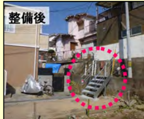
▲「行き止まり解消階段」設置 (泉が丘3丁目)

城が山北エリアでは、9月20日秋晴れの中、行き止まり道路の先にあるブロック塀に設置された避難扉の「城が山北エリア第1号開通式」が実施されました。これは、地震や火事などの緊急時に2方向避難できる、緊急避難サポート事業により設置された扉です。