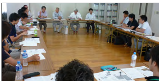
六甲北で地元の役員、専門家の話を聞く

また、野田北部地区や六甲道駅北地区のまちづくり協議会の役員やコンサルタントとの意見交換と現地視察、さらに産業の復興状況、災害公営住宅では高齢化が進む入居者の見守りの状況、高台造成地や高盛土の実績など今後被災地で展開する事業の視察も実施し、連日盛り沢山のタイトなスケジュールになりました。