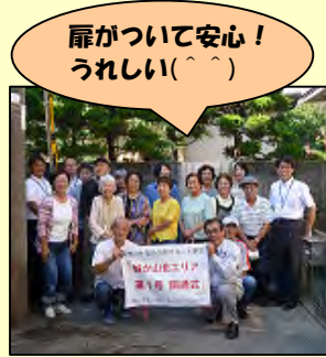
▲城が山北エリア第1号開通式

避難扉の設置には、設置する扉などの所有者の協力が欠かせません。2方向避難が確保でき、喜んでおられる沿道の住民の方々と所有者の温かい交流が感じられる開通式でした。