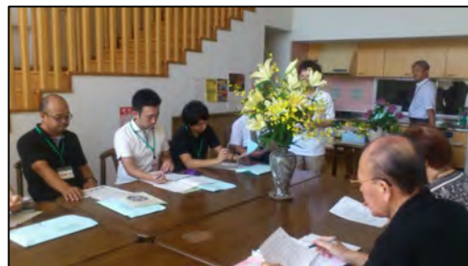
災害公営住宅で高齢者の見守りの状況を聞く