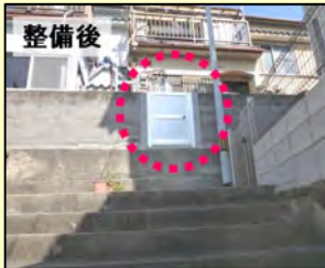
▲「避難扉」設置 (泉が丘5丁目)

密集市街地の1つである東垂水地区では、東垂水地区まちづくり推進会が安全・安心なまちづくりの実現に向け、自治会と連携した取り組みを行っています。今年3月には、泉が丘北エリアで行き止まり通路の扉に避難扉の設置と段差解消のための階段を設置しています。