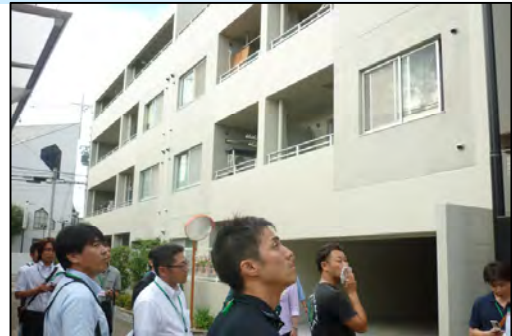
野田北部を視察する(共同建替えの事例)

また、野田北部地区や六甲道駅北地区のまちづくり協議会の役員やコンサルタントとの意見交換と現地視察、さらに産業の復興状況、災害公営住宅では高齢化が進む入居者の見守りの状況、高台造成地や高盛土の実績など今後被災地で展開する事業の視察も実施し、連日盛り沢山のタイトなスケジュールになりました。